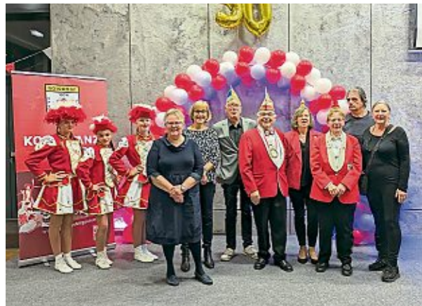
Stolz auf die Mariechen sind der neue Vorstand (l.) und die Gründungsmitglieder (r.).